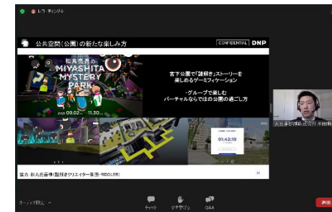
講演 小田将史氏 (大日本印刷株式会社)