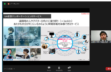
基調講演 名塚一郎氏 (凸版印刷株式会社)