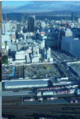
会場から見た大阪 駅北地区開発現場