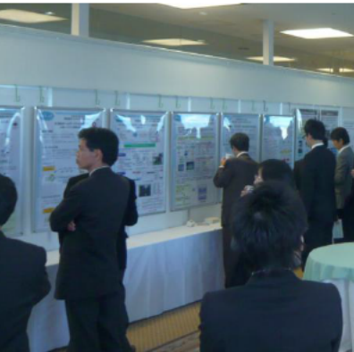
ワーキンググループ会員企業 や関連団体のポスター展示